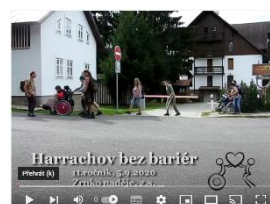
Harrachov bez barier 2020