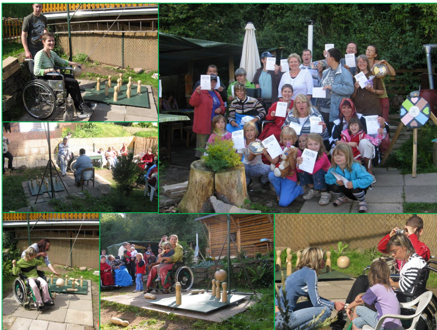
Fotografie z 2009

Pro vyrovnání pozice lidí se zdravotním omezením budou hrát tradičně zdraví lidé na mechanickém vozíku nebo židli.